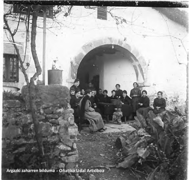
Mende hasieran, baserriko ezkontza ospakizuna.