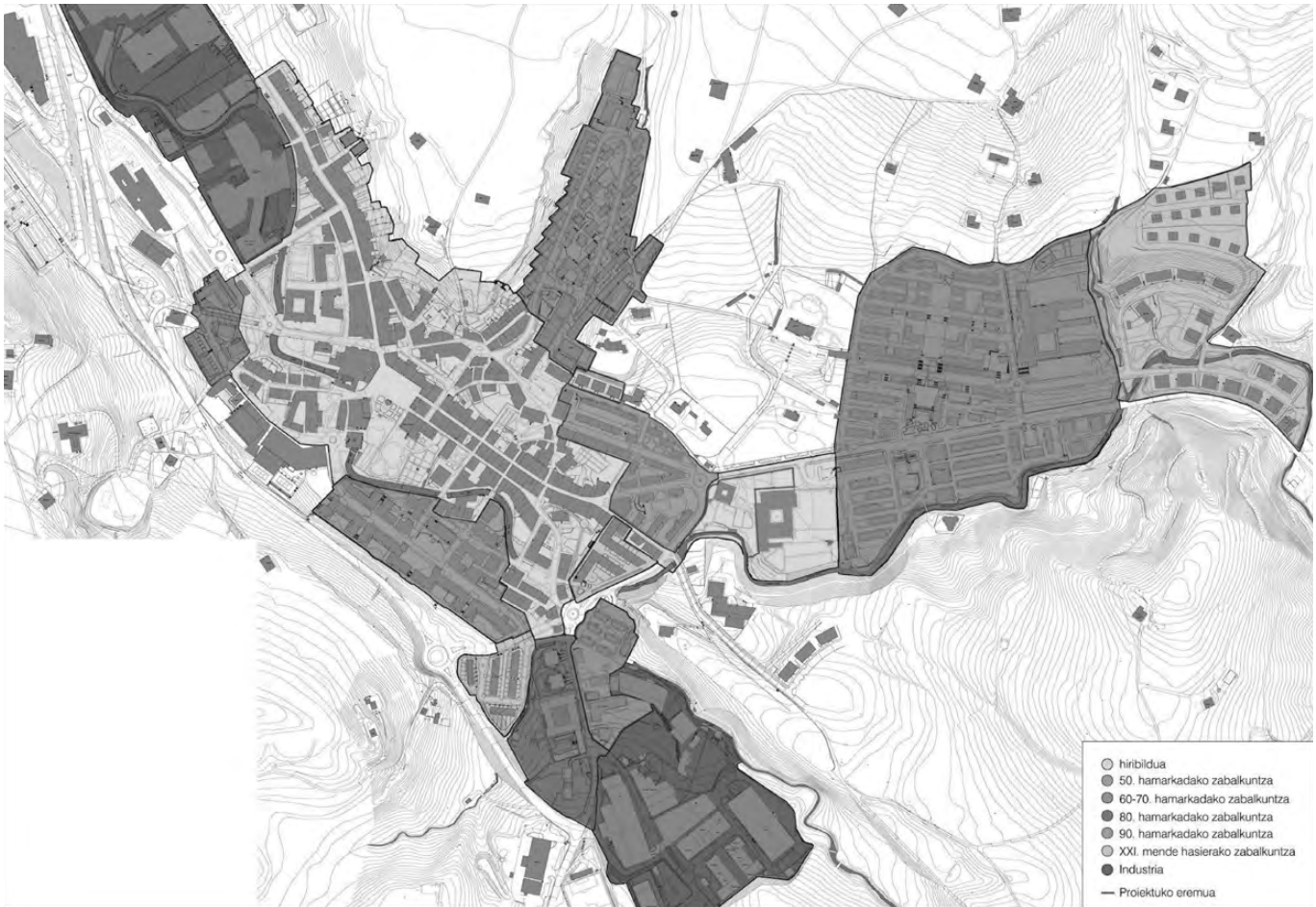
Oñatiko erdigunearen hazkunde-prozesua. Eneko Soto (2014)

1950eko hamarkadan hasi ziren erdigunearen periferian industrialdeak handitzen: ordukoak dira Otadui zuhaitziaren ezkerretatik Kasablanka auzo arteko industrialdea eta Berezaoko poligonoa. 1960ko hamarkadan erdigunetik hurbil bizitoki berriak eraikitzeari ekin zitzaion: Roke Azkune auzoa, Euskadi-etorbidea eta Kurtzebidetako pisuak, Etxaluzeko etxea berriztu eta atzean eraikitako auzogune berria (Martzelino Zelaia eta Lazarraga kalearen artean), Olakua auzoa eta Errekaldereen hasiera.