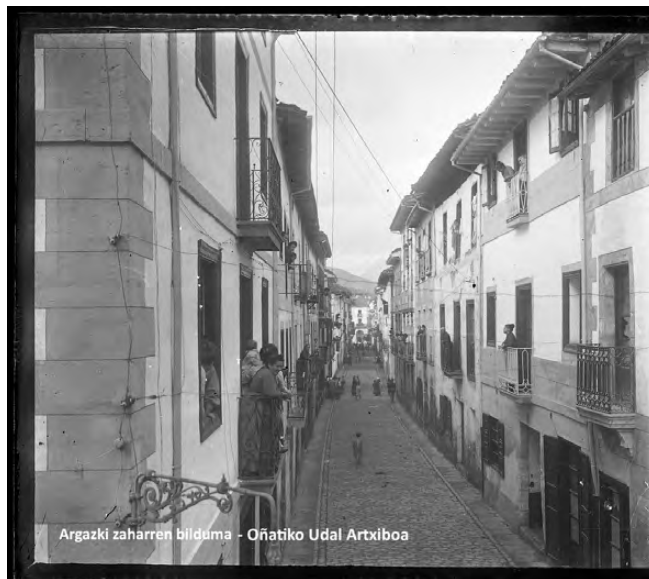
Argazki zaharren bilduma - Oñatiko Udal Artxiboa

Hala izan da Angela Gliaren (2012) iritziz: kontsumoa etxetik irteteko bitarteko bat da, identitatea sortzeko bide bat izan da, aipatu kontsumismoaren fenomeno hedatzen hasi aurretik ere bai. Kontsumismoarako joera sortu zenean, publizitate agentziek emakumezkoak zituzten jopuntuan: hura zen konkistatu beharreko kolektiboa, haiek baitziren etxeko ekonomiaren arduradunak. Hala, etxerako produktuen kontsumitzaile sutsuak bilakatu nahi izan zituzten, eta hein batean, baita lortu ere (Nash, 2012: 167). Erostearen bidez identitate bat sortzeko, sare bat egiteko modua aurkitu zuten emakumeek.