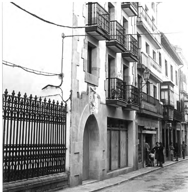
Kooperatibarako sarreran emakumeak errekadutan.