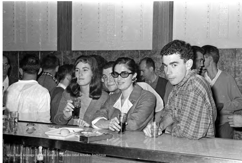
Emakume gazteak tabernan.

“Lehen radixua bakarrik, partiduak eta entzuteko, orain, musika bariko taberna baten zerbait inportantia falta dala esan leike. Eta, telebisiñua