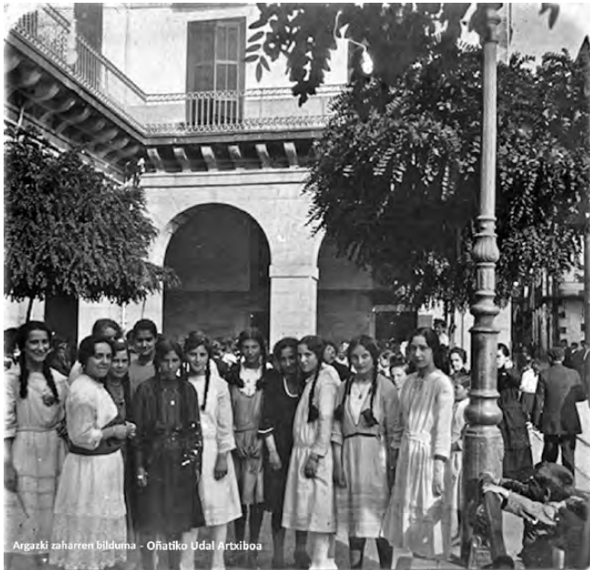
Mende hasierako neska taldea plazan.

Hezkuntza eta harreman-sarea lotuta egon dira, mende erditik gaur egunera arte: eskola eta institutuko kideak izango ziren gerora kuadrillakoak. Mende hasieran jaiotako emakumeen kasuan, maila ekonomikoak eta bi-