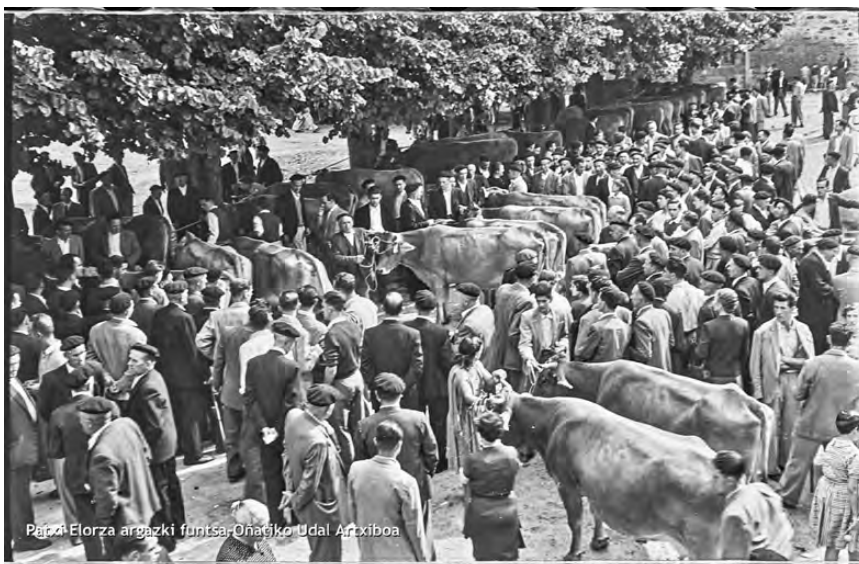
Ganadu feria Santamarina plazan, mende erdian.

Oñatiko baserritarrak zein inguruetakoak etorri ohi ziren feria eta merkatura. Merkatu zaharrean postuak definituta zeuden, eta besteak beste, barazki-saltzaileak, landare-saltzailea, harakinak, arraindegia, oihal-saltzailea, kinkalleroa eta karamelero etortzen ziren. Janari-denda zutenek ere jar zezaketen postua, eta noski, larun-