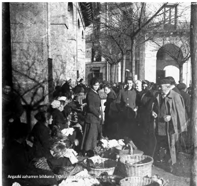
Argazki zaharren bilduma - Oñatiko Udal Artxiboa