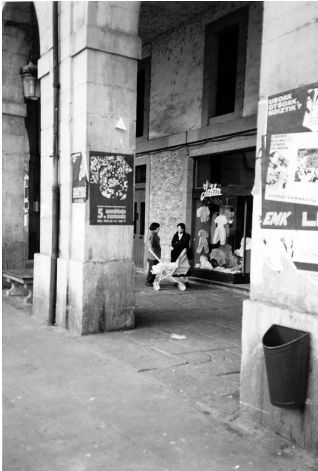
Emakumeak denda sarreran.

hamarkada amaiera aldera jaiotako emakume belaualdi berriek (Ramon, M, 1993: 669):