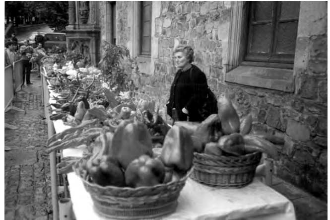
Joxuena baserriko postua Herri Egunean.

“Baserriko jentia feixa eguna aprobetxaitten ebein. Batzuk ia goizetik agerketan zian kalia, eta beste batzuk autobusian. Lehengo bezeruak, hurriñen euzen baserritako jentia. Atian itxoitten. Goizian jente gaztia, baserriko jente gaztia. Eurak mezia entzun mezia derrigorra zan e? Euran mezia entzun eta meza ondorian uetakuia iñ, Naparrenan, Urubilen o lokesea, eta tapa tapa tapa etxera. Eta