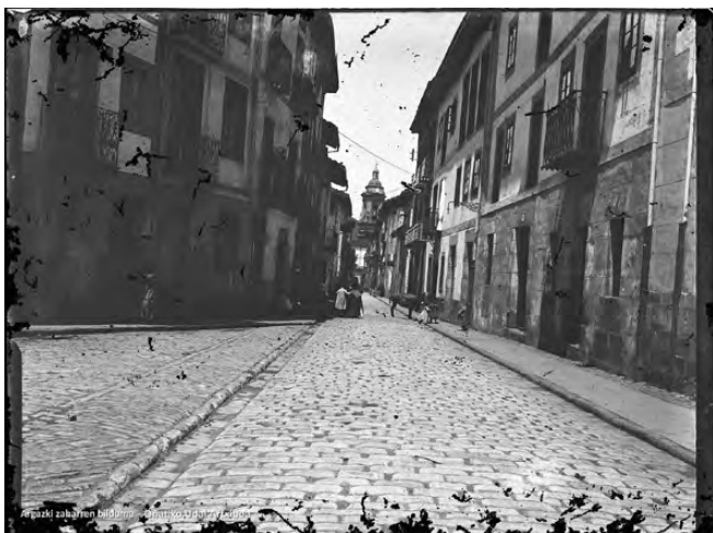
Merkatarien egunerokoa atzeko kalean, mende hasieran.

Etxeko tresna, altzari eta abarren kasuan ere, kantitate handiko erosketak izanik, epeka ordaintzea oso ohikoa izan da: “saltzen zanian izaten zan, batzutan, ba hiru hilabete barru pagaukotzut. Diru asko zan ta batzuk pagaitten ebein a plazos” (E40-1).