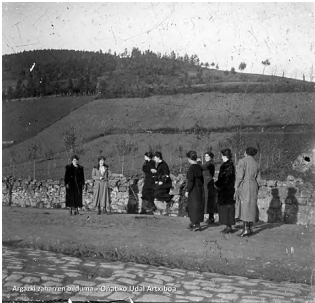
Neska taldea soka-saltoan.

Gauean neskek betiere goiz erretiratzen ziren etxera gurasoen kontrola handia izaten baitzen.