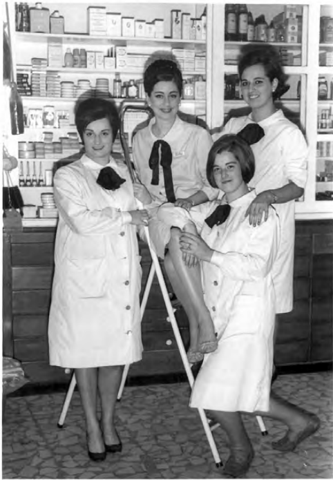
Garbi drogeriako ahizpak.