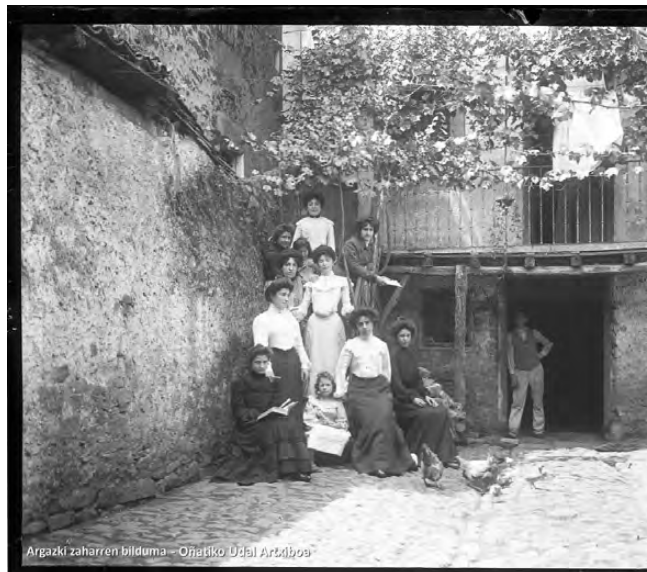
Emakume senideak etxe atarian.

XX. mende hasieran emakumeen bazterketa legalki baimentzen zuten hiru oinarri finkatu ziren: 1870eko Kode Penala, 1885eko Merkataritza Kodea eta 1889ko Kode Zibila (Hernández, 2008: 292). Jabetza eta herentzia jasotzeko eskubidea debekatzen zitzaie, baita hezkuntza jasotzea, lanbide liberaletan jardutea eta soldata jasotzea ere (Nash, 2012: 34).