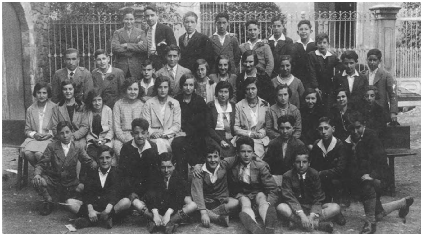
20ko hamarkadako hezkuntza mistoa.