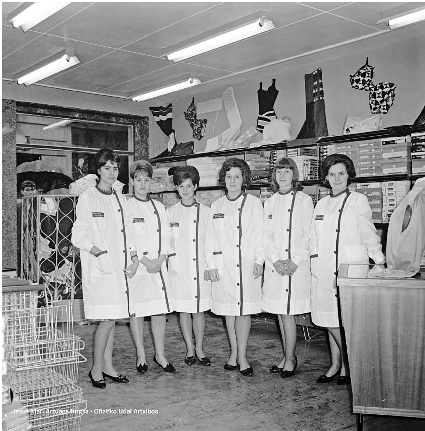
San Miguel kooperatiba 6ko hamarkadan.