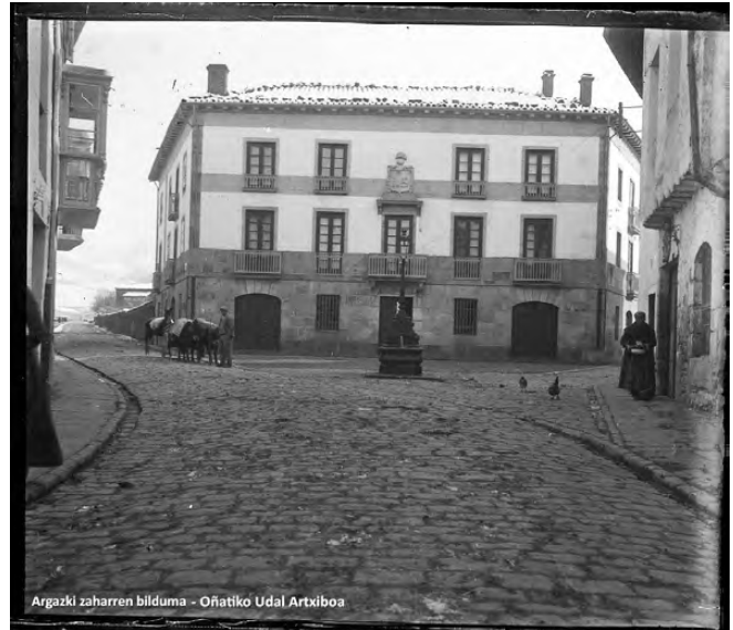
Emakumea errekadutan Etxaluzen mende hasieran.

1961 arte iraun zuen debekuak. Urte horretan onartu zen “Ley sobre derechos políticos, profesionales y laborales de la mujer”, eta ezkondu- ta egon arren enpleguari eusteko baimena eman zen. Legeak baimendu arren, jendarte- an praktika hori hedatuta zegoenez, askok eta askok lana utzi zuten 1960ko hamarkadan. Hortaz, 1970eko hamarkadara arte, enplegua zuten emakume helduak ezkongabeak edo alargunak ziren; edota fami-