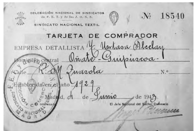
Urtaza ahizpen mertzeriako irekiera lizentzia.