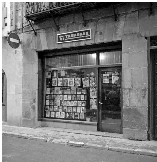
Altuna estankoa kanpotik.

Egunkariak, liburuak, aldizkariak estankoetan saldu izan dira historikoki: 1940an Estanku zaharren (Plaza, 10) eta Altunan (KB 23) saltzen zituzten. Ondoren Ibarrendon (Plaza, 9) eta Irizarren (Plaza 5) ere.