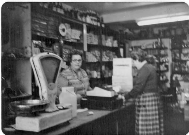
Kontxesen denda portalekuan.