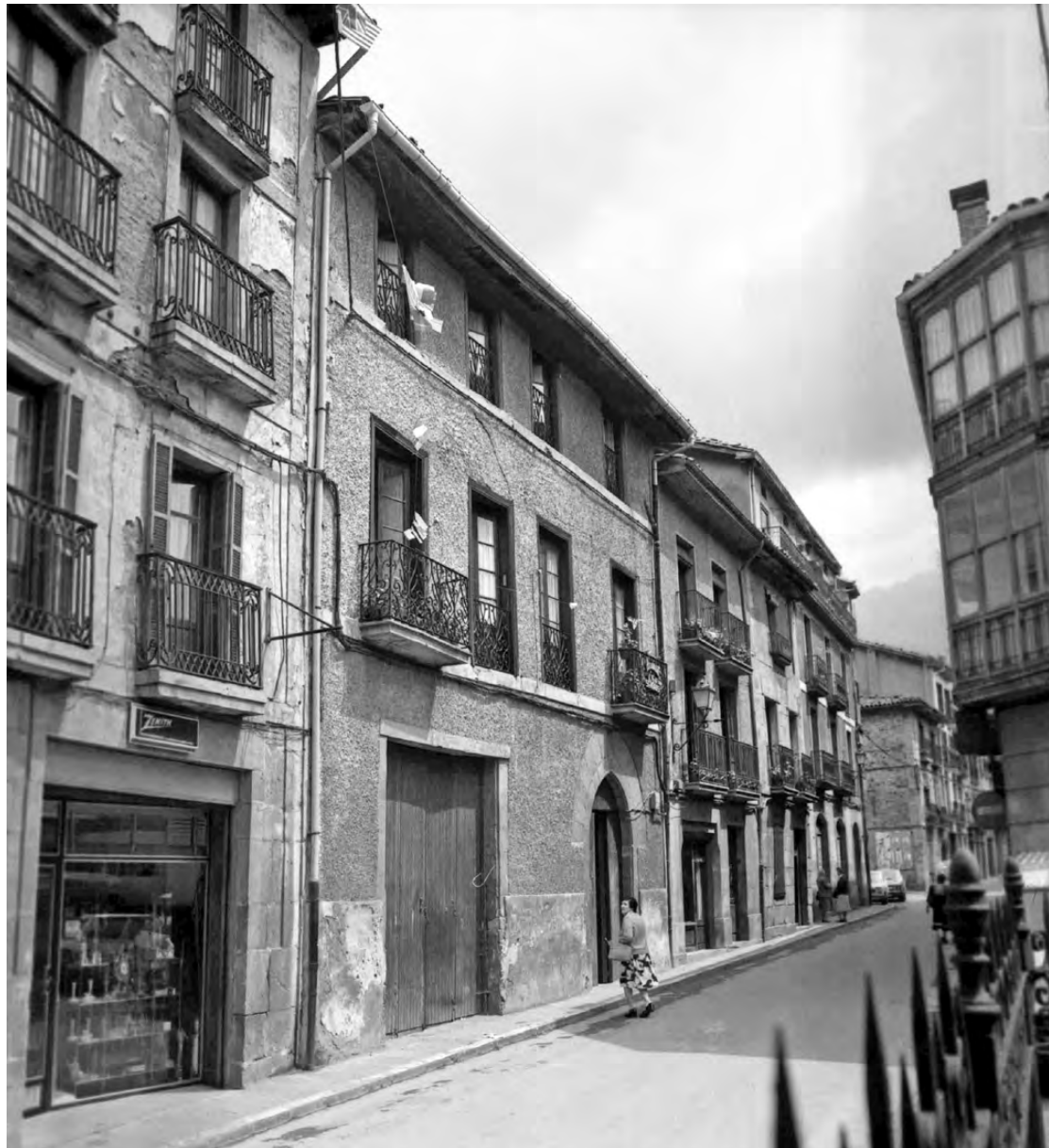
Kale zaharra 7oko hamarkadan.

Bestalde, merkatariiek herritarrei sostengu soziala emateaz gain, haiek ere jaso egin dute. Izan ere, saltzaile edo dendari emakumeentzat bezero aurreko lana, bitarteko espazio horren okupazioa, enplegu bat izateaz gain, bizimodu bat izan da: jendearekin harremantze-